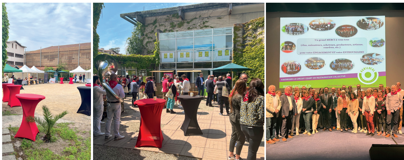
Les Co-Présidents de l'association nationale Agrilocal

10 ANS D'UN MÊME LEITMOTIV : ENSEMBLE, SOYONS ACTEURS DU MANGER MIEUX, DU MANGER BON, ET DE LA PROMOTION DES CIRCUITS COURTS SUR NOS TERRITOIRES !